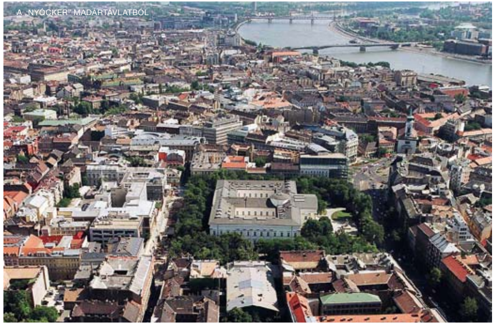
A „NYÓCKER” MADARTÁVLATBÓL

K. M.: A CorvinSétány jelentős és nagyon komoly erőfeszítéseket kívánó kötelezett-ségvállalása Józsefvárosnak, ezért a kerület vezetősége mindig kiállt a projekt mellett. Azonban a Corvin Sétányra önmagában nem építhetünk. Józsefváros sokarcú település-szerkezete és társadalmi viszonyai más-más jellegű odafigyelést igényelnek. A leghatványosabb városrész a Magdolna negyed, amelynek rehabilitációját uniós forrásból és önerőből végezzük, ám egyes közterületek felújítására csak ez a hitel ad lehetőséget. A hitelsomagból egymilliárd forint a történelmi Belső-Józsefváros, a páratlan építészeti és kulturális örökséggel rendelkező Palotanegyed fejlesztését segíti majd. A program az Euró-