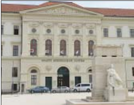
A Nemzeti Közszerológati Egyetem főépülete

A városfejlesztéshez megalapozott koncepció szükséges, most készül a főváros integrált fejlesztési stratégiája, amely a 2030-ig szóló városfejlesztési programra épül. A stratégiában az élhető város kialakítása a cél. Ennek része például a Duna kihasználása, de nem csak a belvárosban, hanem a főváros 25 kilométeres szakaszán – mondta Tarlós István. A főpolgármester előadásában ki-