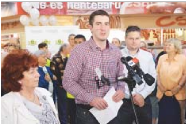
Kocsis Máté polgármester nyitotta meg az új piacot

Józsefváros önkormányzata kizárólag saját forrásból építette fel az új Teleki téri piacot, ahol immár igényes környezetben és megfizethető árakon vásárolhatnak a kerület polgárai és az ide látogatók. A piac újraindításával véghezvittük azt, amit előttünk sokan nem tudtak megcsinálni. A vásártér környezete is megújul, hiszen elkezdődött a Teleki tér felújítása is, számos ház újult meg, és az itt lakók tervei alapján szépül meg a park is – fogalmazott Kocsis Máté polgármester a megnyitón.