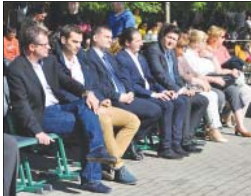
A díszvendégek: olimpikonok és képviselők

zsefvárosi lakosnak joga van hozzá, hogy kulturált, rendezett körülmények között éljen, tanuljon és dolgozzon. Az önkormányzat eddig is sokat tett a kerület, azon belül – többek között – a Losonci tér és környékének megújulásáért, a közbiztonságért és a tisztaságért. Noha még számos tennivaló akad, a lakosság visszajelzései és a választási eredmények is elégedettségről tanúskodnak, ezért a jövőben is a már megkezdett utat szeretnék folytatni.