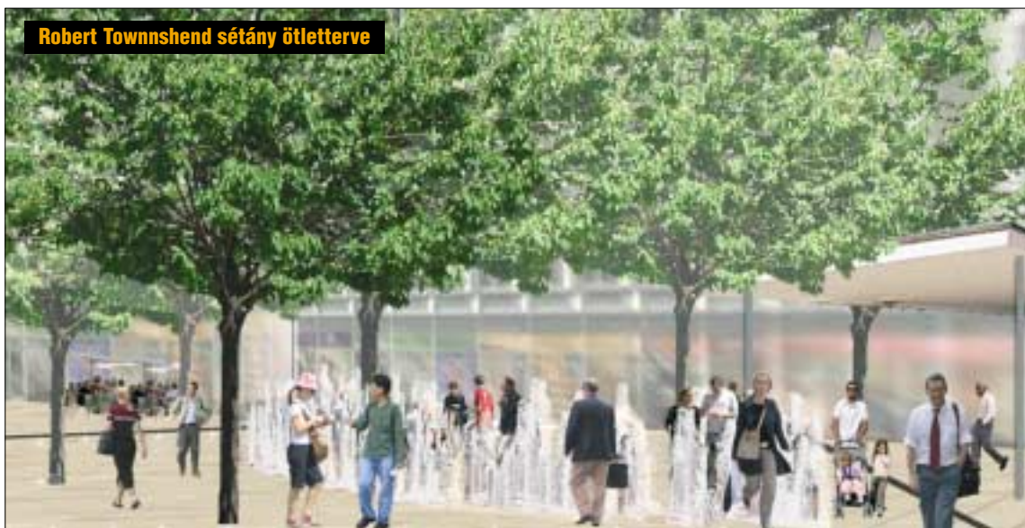
Robert Townshend sétány ötletterve

Lesznek szökőkutak, teraszok, sok zöld felület,