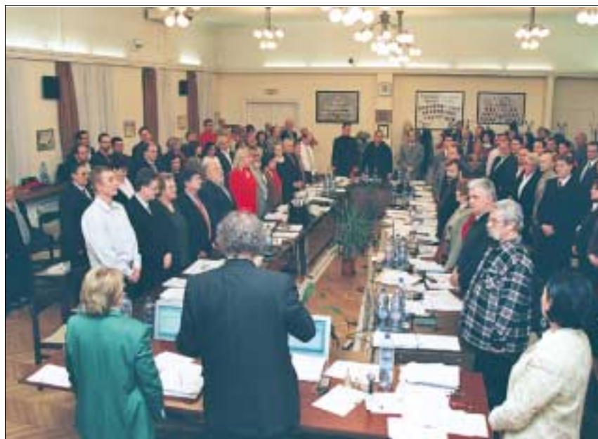
A megválasztott alpolgármesterek és a megszavazott szakbizottsági tagok ünnepélyes esküt tettek

Felvetődött még, hogy már a televízióban is bemutatnák azt az áldatlan állapotot, amely a Köztársaság téren van. A parkban állati és emberi ürülék, hajléktalanok, szemét és széttört padok fogadják az arra járókat. Azontúl, hogy esztétikailag ronda, még fertőzés-veszélyes is a sok ürülék a parkban. Nyilvános illemhely pedig nincs a környéken. A hivatal ez ügyben csak annyit tud tenni, hogy értesíti a fővárosi önkor-