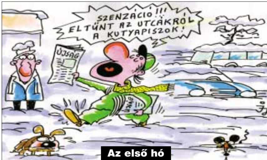
Az első hó