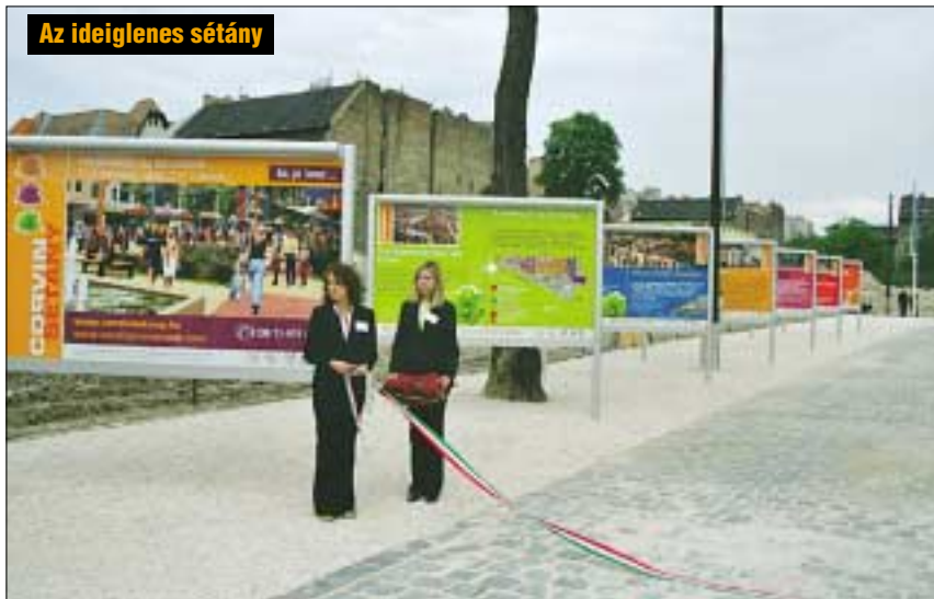
Az ideiglenes sétány