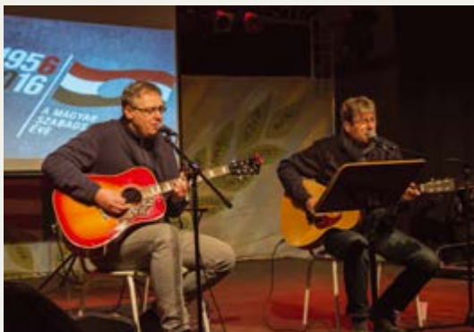
Cseh Tamás-émlékkoncerttel zárult a programsorozat

Folyamatosan várta látogatóit Józsefvárosban a szeptember 20-án nyílt Pesti Srácok Emlékpark, ahol az érdeklődők '56 ismert és ismeretlen hőseinek mindennapjaival találkozhattak. Fiatalok és idősek egyaránt ingyenesen vehettek részt a különböző színes programokon. A rendezvénysátorban megelevenedett a korszak művészete, sportja, divatja, étkezési szokásai is, emléket állítva ezzel a forradalmi eseményeknek és a korabeli hétköznapiaknak. A szervezők történelmi, kulturális és gasztronómiai visszaemlékezésekkel, filmvetítésekkel, előadástekkel, színházi előadásokkal, koncertekkel, korabeli ruhákat felvonultató divatbemutatóval valamint airsoft-lövészettel készültek az Emlékparkba látogatóknak.