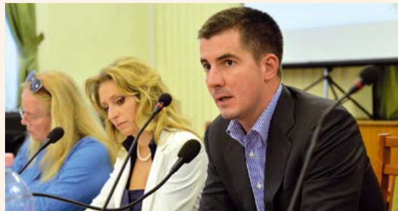
Kocsis Máté: Józsefváros 2014 óta egy olyan rendszerben kezeli a drogproblémát, amely más városok elé is példát állít

„Sokan sokféleképpen viszonyultak már az üggyhöz, a szándék azonban egységes, ami reményt ad ahhoz, hogy Kőbányán túl Józsefváros más önkormányzatokkal is együtt tudjon működni ebben a témában a jövőben” – fogalmazott. A polgármester végezetül kiemelte: Józsefváros 2014 óta egy olyan rendszerben tudja ezt a kérdést kezelni, amely már más városok elé is példát állít.